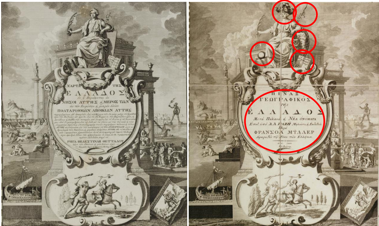
Ο τίτλος στη Χάρτα και τον Πίνακα. Εντοπίζονται οι προσθήκες του Γαζή.