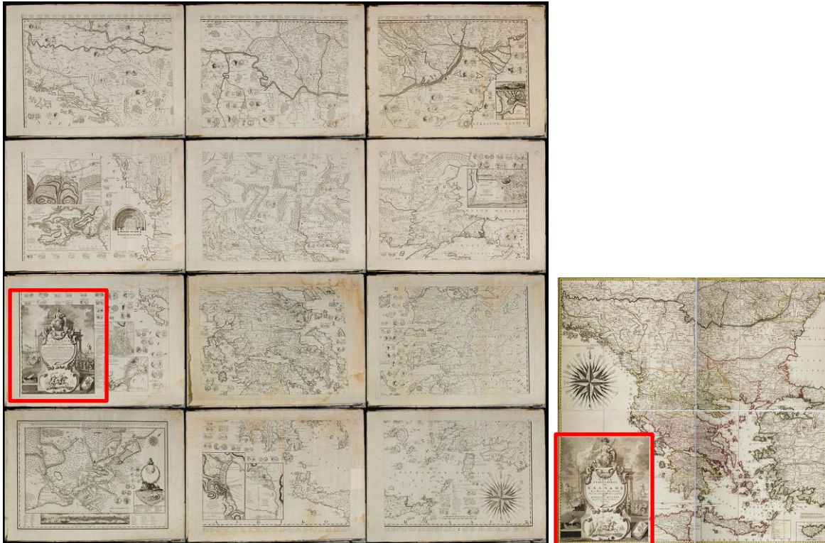
Σχετικό μέγεθος της Χάρτας του Ρήγα (210x200 εκ., ~1:600.000) και του Πίνακα του Γαζή (104x104 εκ., ~1:1.200.000). Με κόκκινο σημειωμένος ο τίτλος στους δύο χάρτες.