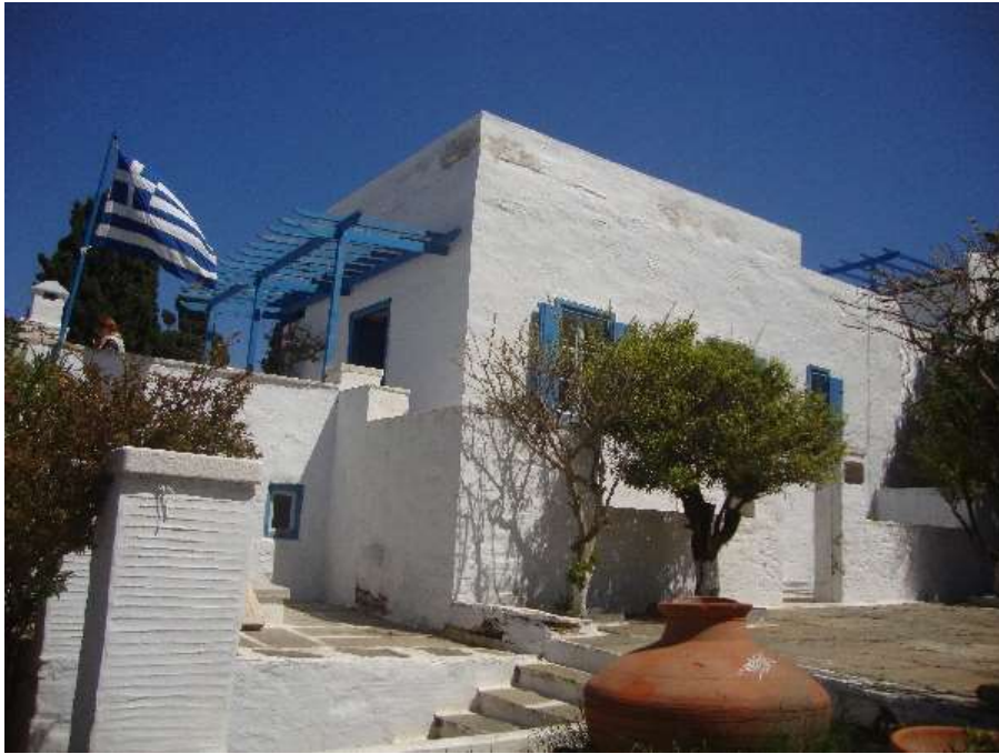
Άποψη από το εξωτερικό της οικίας του Γιαννούλη Χαλεπά στον Πύργο της Τήνου.