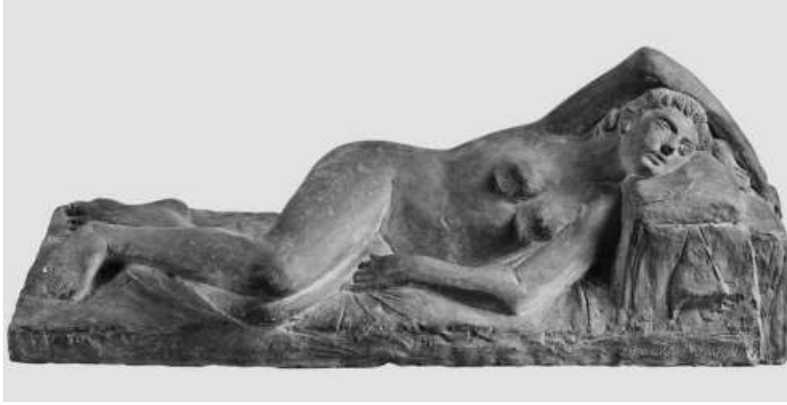
Κόρη με τριαντάφυλλο, 1937

Γύψος, 45×148×45 εκ., ενυπόγραφο, ιδιωτική συλλογή