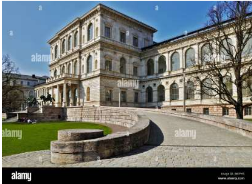
Άποψη από το εξωτερικό της Ακαδημίας Καλών Τεχνών στο Μόναχο.