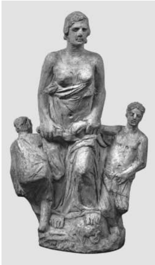
Μήδεια III, 1933

Γύψος, 72×24×43 εκ., ενυπόγραφο, Αθήνα, Εθνική Πνακοθήκη-Μουσείο Αλεξάνδρου Σούτσου, αρ. ευρ. 1470