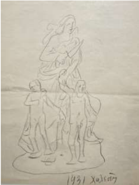
Μήδεια (σε κάδρο), ενυπόγραφο, 1931