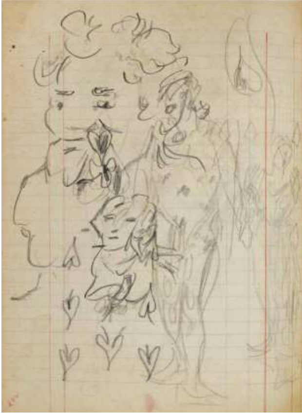
Ο Σάτυρος, Κατάστιχο αρ. III