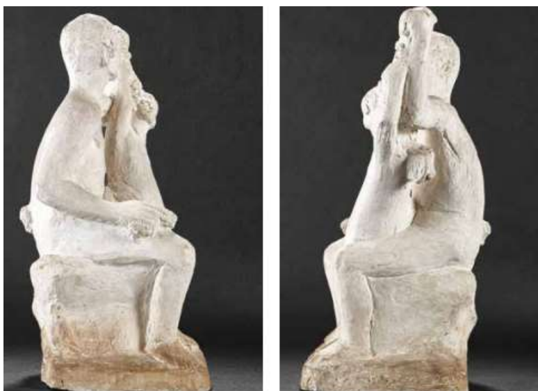
Απόψεις του έργου Σάτυρος και Έρωσ XII , 1936

Γύψος, 59×29×25 εκ., ενυπόγραφο (αριστερά κάτω στη βάση), Αθήνα, Ίδρυμα Ωνάση, S.00077