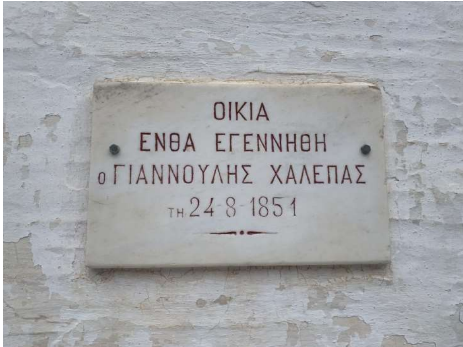
Άποψη από το εξωτερικό της οικίας του Γιανούλη Χαλεπά στον Πύργο της Τήνου.