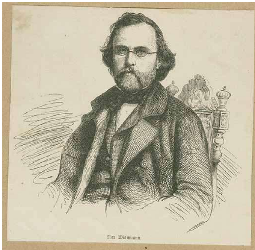
Ο καθηγητής του Γιανούλη Χαλεπά στην Ακαδημία Καλών Τεχνών του Μονάχου, Max von Widmann (1812-1895).