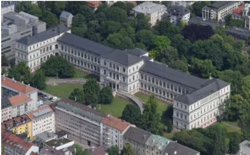
Αεροφωτογραφία της Ακαδημίας Καλών Τεχνών στο Μόναχο.