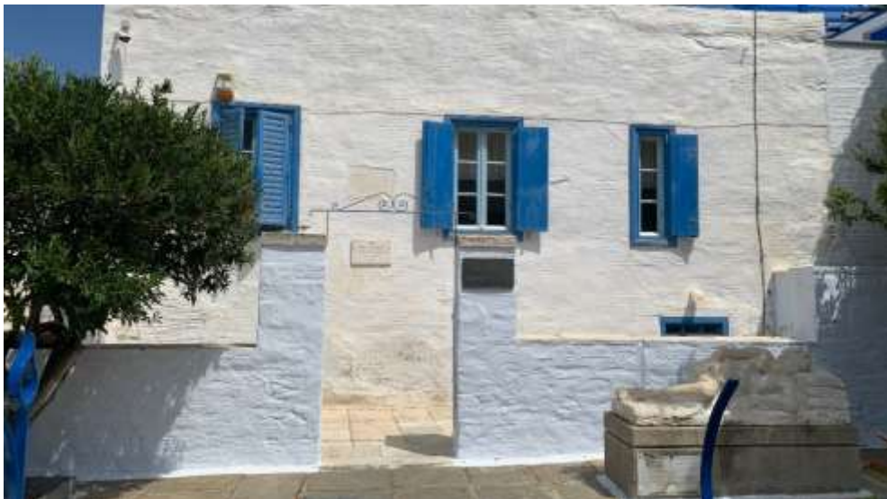
Άποψη από το εξωτερικό της οικίας του Γιανούλη Χαλεπά στον Πύργο της Τήνου.