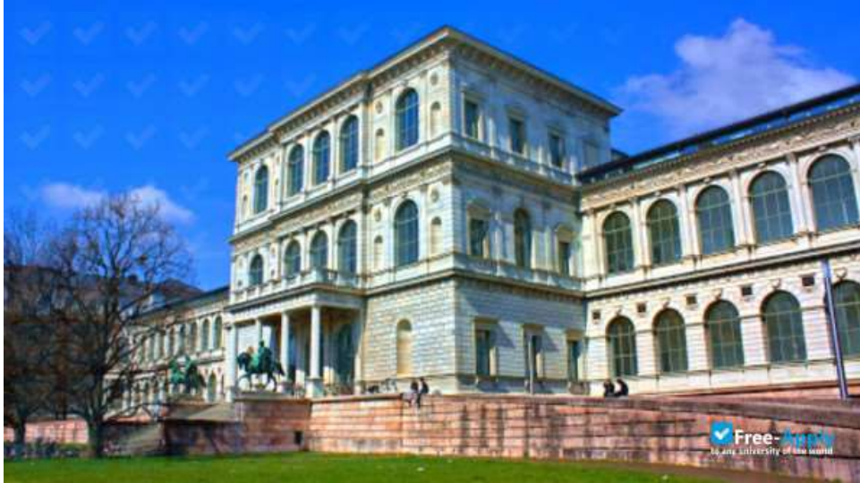
Άποψη από το εξωτερικό της Ακαδημίας Καλών Τεχνών στο Μόναχο.