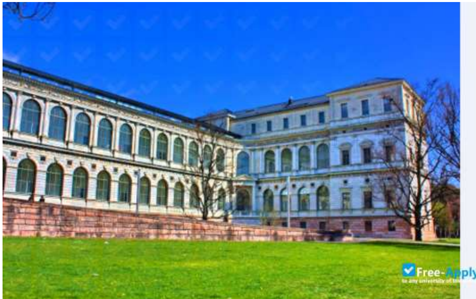
Άποψη από το εξωτερικό της Ακαδημίας Καλών Τεχνών στο Μόναχο.