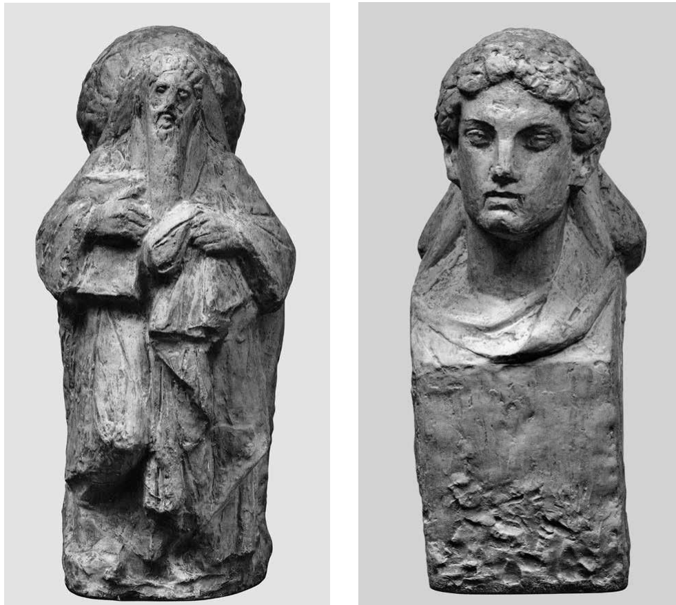
3] Άγιος Χαράλαμπος και Ερμής , πριν το 1925.

Επιπλέον, αναφορικά με το θέμα, παρατηρούμε ότι αντιπαραθέτει τον αρχαίο θεό με έναν άγιο της ορθοδοξίας, μια επιλογή που εκ πρώτης όψεως φαίνεται παράδοξη. Ωστόσο, ο ίδιος εξηγούσε ότι με την σύνδεση των δύο ετερόκλητων μορφών, ήθελε να υπογραμμίσει «τους δεσμούς του αρχαίου με το νέο θρήσκευμα».