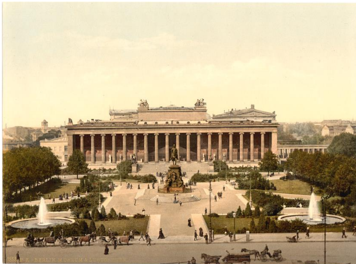
Το Altes Museum στο Βερολίνο γύρω στα 1890-1900.