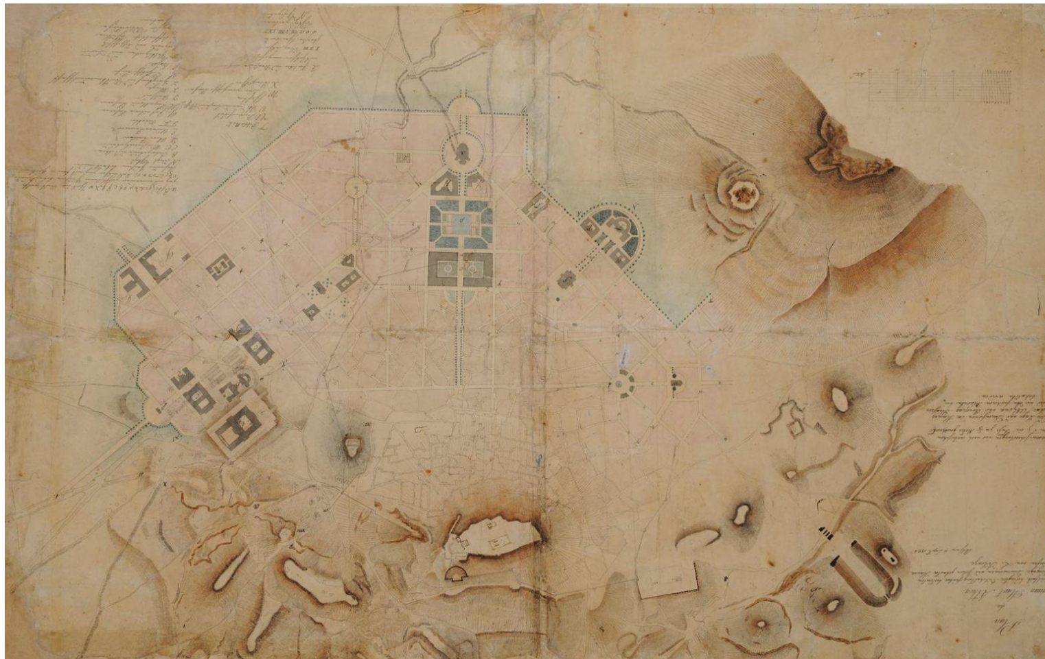
Το σχέδιο Κλεάνθη-Schaubert όπως τροποποιήθηκε από τον Leo von Klenze.