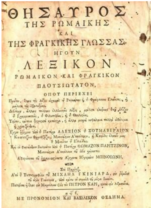
Αλέξιος ό Σουμαβέραιος / Alessio da Somavera (Sommevoir), Θησαυρός τής Ρωμαϊκής καί τής Φραγκικής γλώσσας... , τ. I-II, Παρίσι 1709. Ωνάσιος Βιβλιοθήκη