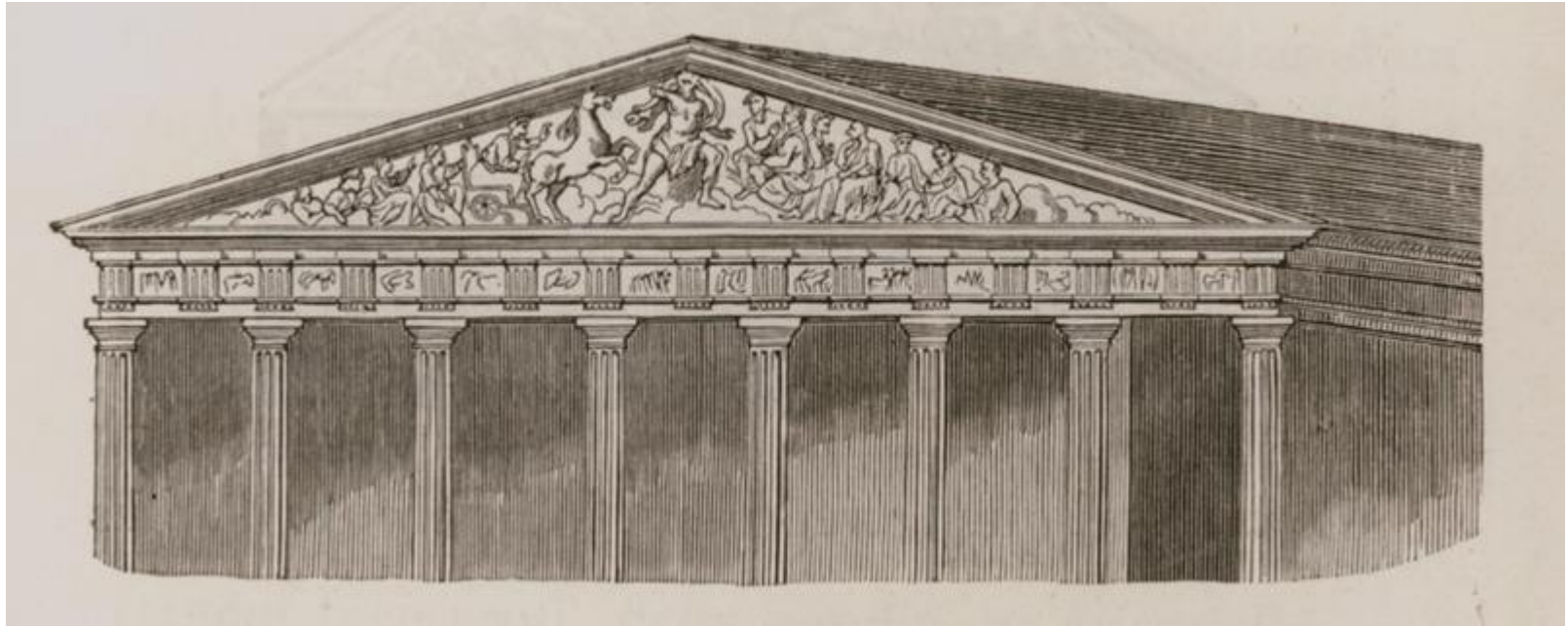
Το δυτικό αέτωμα του Παρθενώνα κατά τον Ντ' Οτιέρ (D'Otthières), περί τα 1685. LABORDE, Léon Emmanuel, Athènes aux XVe, XVIe et XVIIe siècles , Παρίσι 1854.