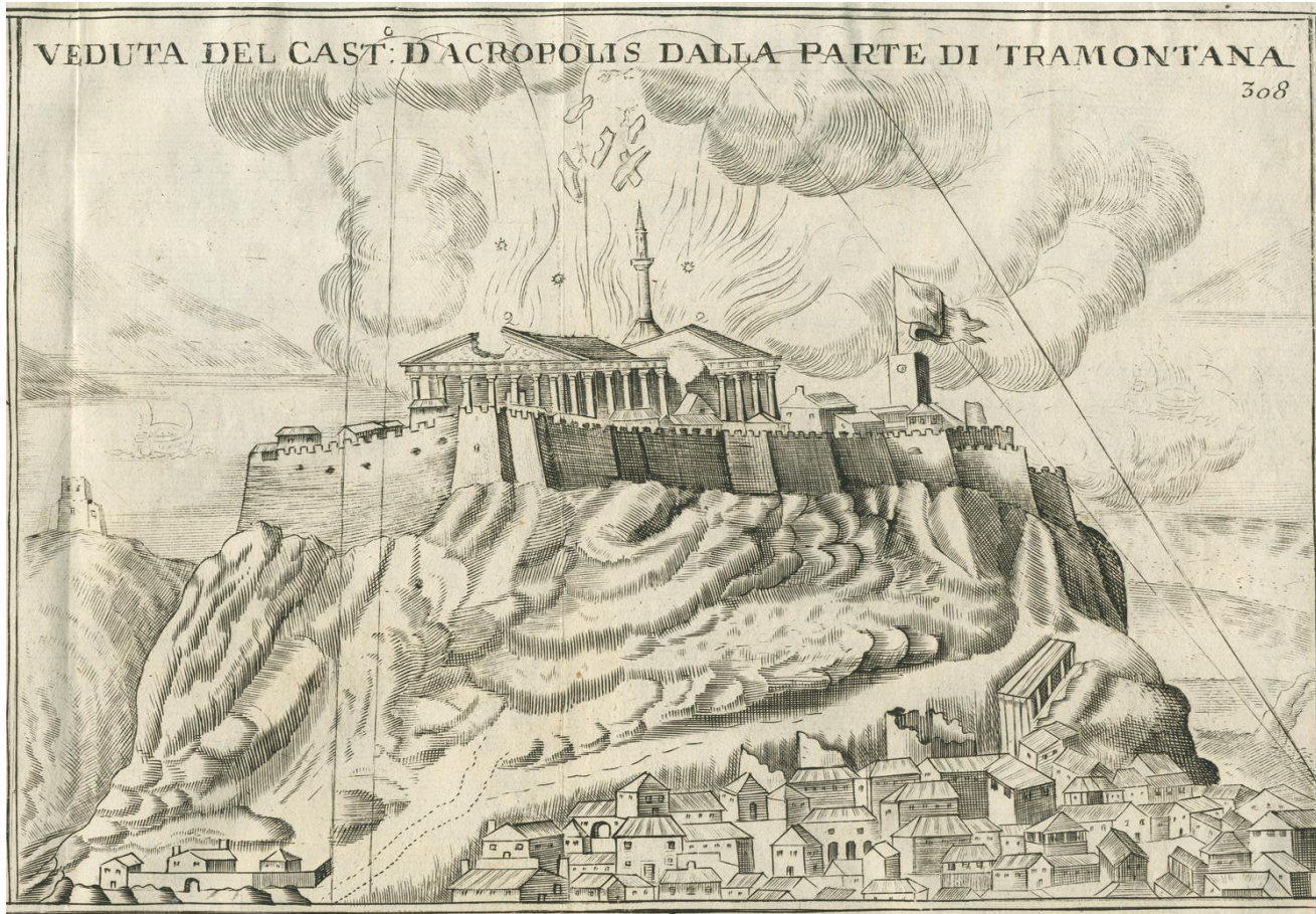
Άποψη της Αθήνας και της Ακρόπολης, Σεπτέμβριος του 1687. FANELLI, Francesco, Atene Attica: Descritta da Suoi Principii fino all'acquisto fatto dall'Armi Venete , Βενετία 1707.