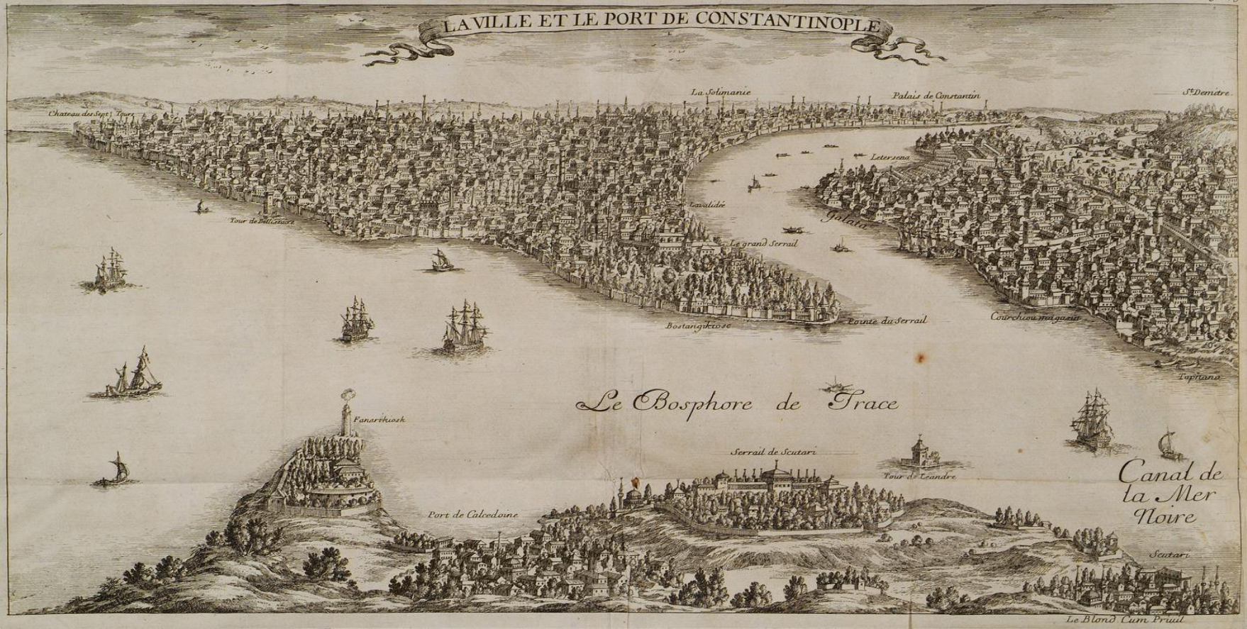
Άποψη της Κωνσταντινούπολης από την ασιατική όχθη.

GRELOT, Guillaume-Joseph, Relation nouvelle d'un voyage de Constantinople , Παρίσι 1680.