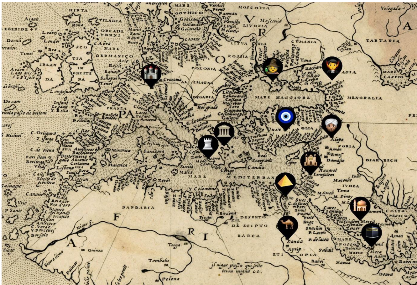
Τα ταξίδια του Εβλιά σ' έναν χάρτη της εποχής!