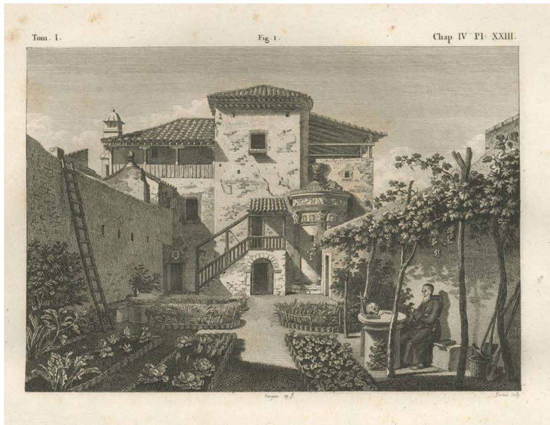
Εικόνα 2: Η μονή των Καπουτσίων

Οι μοναχοί προστάτευαν το μνημείο για 150 χρόνια, άνοιξαν μονάχα μια πορτούλα και μετέτρεψαν το εσωτερικό σε βιβλιοθήκη. Ήταν μια έξυπνη κίνηση, καθώς το μάρμαρο προφύλασσε τα πολύτιμα βιβλία από την υγρασία και τις πυρκαγιές. Μπορούμε εύκολα να φανταστούμε ότι μέσα σε αυτή τη βιβλιοθήκη φύλασσαν τον χάρτη τους! Οι μοναχοί παρείχαν επίσης φιλοξενία σε ταξιδιώτες: ο πιο γνωστός από αυτούς που έμειναν εκεί ήταν ο Άγγλος ποιητής Λόρδος Βύρωνας. Σε ένα γράμμα που έγραψε τον Ιανουάριο του 1811, λέει πως σκαρφάλωσε στη σκεπή του μοναστηριού και η θέα της πόλης και των αρχαίων μνημείων τον εντυπωσίασε πολύ περισσότερο απ' ό,τι είχε δει στο Λονδίνο. Επίσης, δεν παραλείπει να αναφερθεί στο διαιτολόγιό του: «Τρώω καθημερινά μπεκάτσες και μπαρμπούνια» μας λέει.