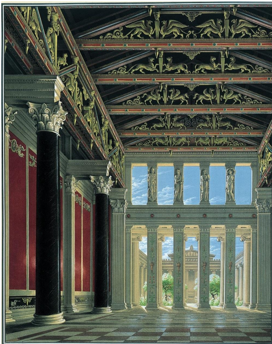
Εικόνα 3: Η μεγάλη αίθουσα του παλατιού.

μακριά κιονοστοιχία θα εκτεινόταν κατά μήκος των βασιλικών διαμερισμάτων προσφέροντας σκιά στα δωμάτια και θέα προς τους λόφους του Φιλοπάππου και της Πνύκας, αλλά και προς τη θάλασσα. Στο τέλος της κιονοστοιχίας ο αρχιτέκτονας σχεδίασε το βασιλικό παρεκκλήσι.