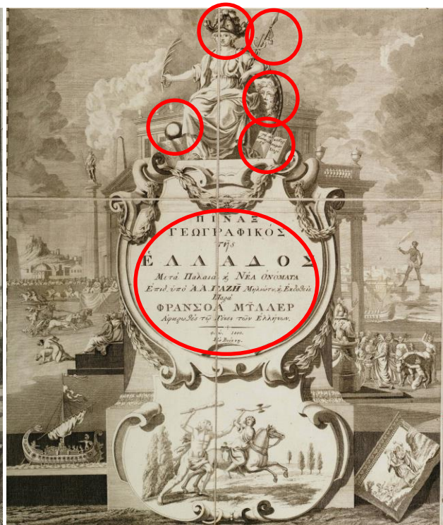
Ο τίτλος στη Χάρτα και τον Πίνακα. Εντοπίζονται οι προσθήκες του Γαζή.