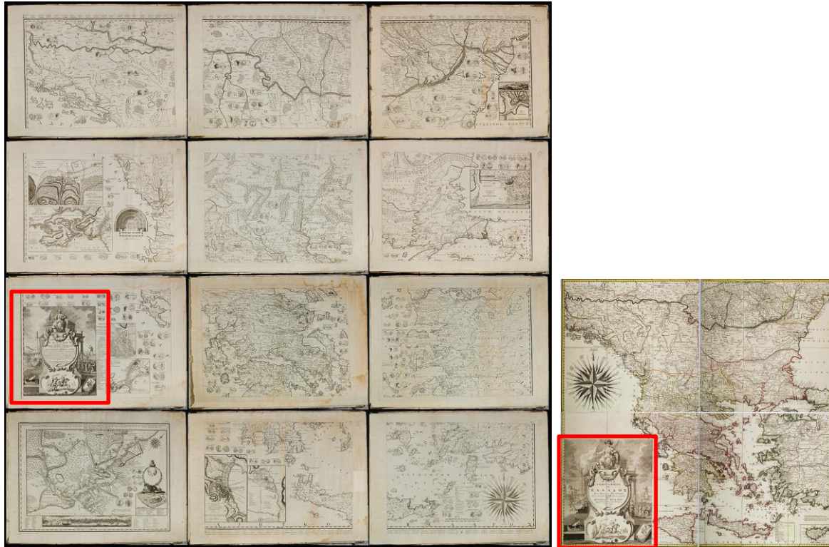
Σχετικό μέγεθος της Χάρτας του Ρήγα (210X200 εκ., ~1:600.000) και του Πίνακα του Γαζή (104X104 εκ., ~1:1.200.000). Με κόκκινο σημειωμένος ο τίτλος στους δύο χάρτες.